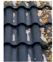
kezelt felület 3 év múlva