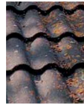
kezelt felület 3 hónap múlva